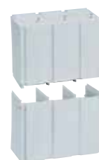
4 242 46