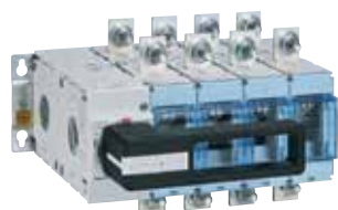
4 241 15 + 4 242 30