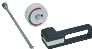
4 242 31